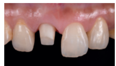
Restauro: Shinya Kuramoto, CDT Iwata Dental Office, Giappone

Se necessario, i restauri monolitici realizzati con SHOFU Disk ZR Lucent Supra possono essere ottimizzati a livello estetico e sigillati con i supercolori e masse di glasura Vintage Art Universal. Se si desidera perfezionare esteticamente una struttura ridotta, si può completare la forma anatomica con le masse dentina e smalto Vintage ZR.